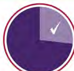
TAUX DE PARTICIPATION DES JEUNES À L'ÉLECTION FÉDÉRALE DE 2011

Seuls 1,1 million des 2,9 millions de jeunes admissibles au vote en 2011 ont exercé leur droit de vote. 2,9 millions d'électeurs admissibles 1,1 million ont voté