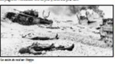
Le raid sur Dieppe.

En 1942, les Canadiens ont participé au raid sur Dieppe, une opération militaire audacieuse pendant la Seconde Guerre mondiale.